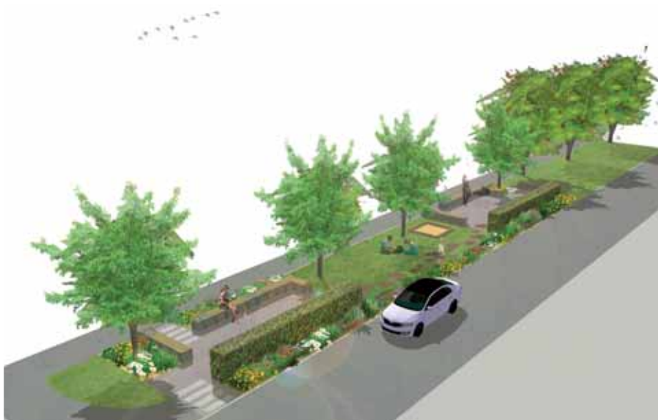
Vizualizácia parčíka na Buzalkovej