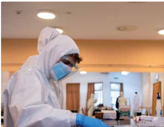
Testovanie vo Vajnoroch