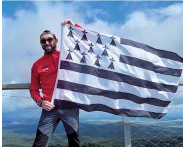
S vlajkou Bretónska

nická chémia, konkrétne príprava materiálov, ktoré môžu očistne pôsobiť na životné prostredie. Je to fundamentálny výskum, ale veľmi dôležitý krok k aplikácii.