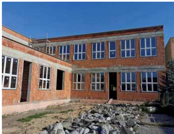
Prístavba základnej školy