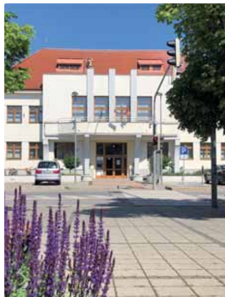
Miestny úrad Bratislava-Vajnory

➤ V spolupráci so Slovenským zväzom ľadového hokeja pripravujeme koncept vybudovania Národného hokejového centra.