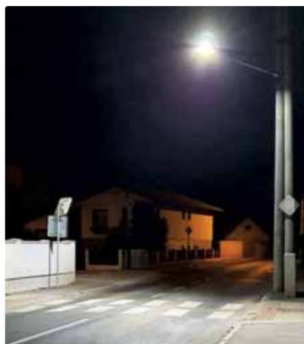
Osvetlené priechody pre chodcov