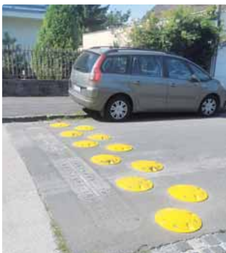
Nové spomaľovacie vankúše