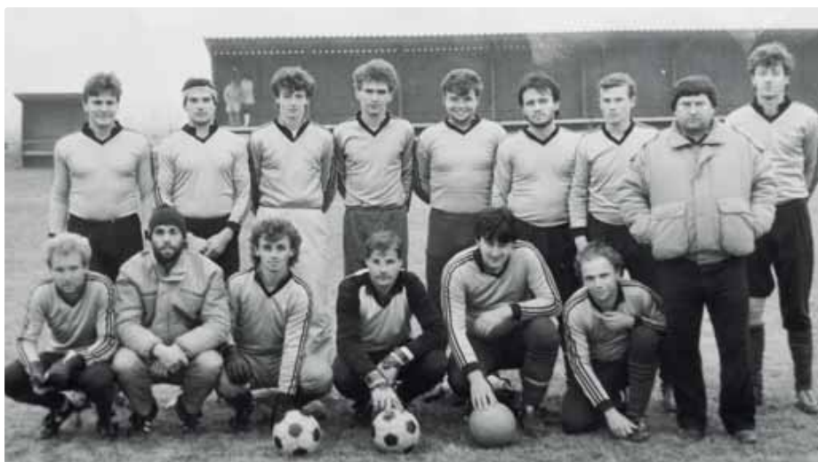
S mužmi na jeseň 1987 (prvý sprava)