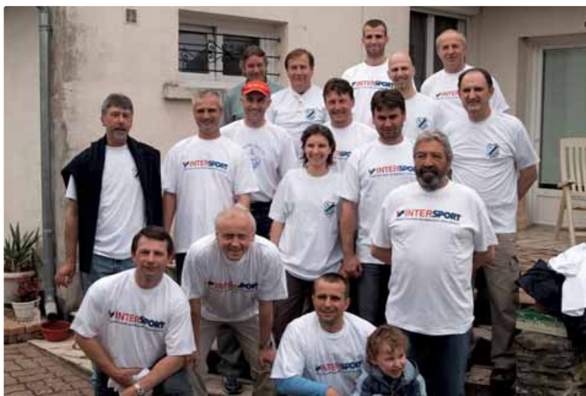
Úspešná hádzanárska reprezentácia Vajnor v Dijone.