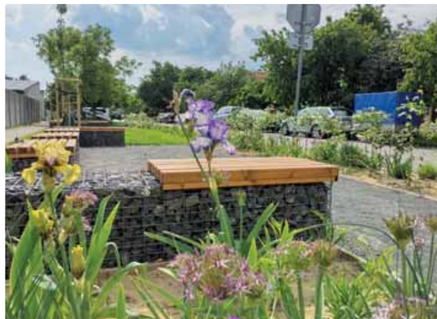
Parčík na Buzalkovej