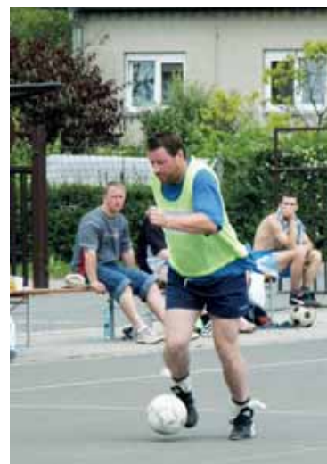
Minifutbalový turnaj (rok 2004)