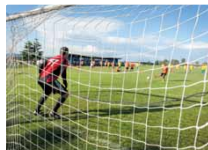
Súboj vyvrcholil penaltami