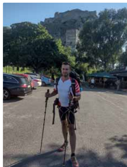
Cesta Hrdinov SNP – Devín