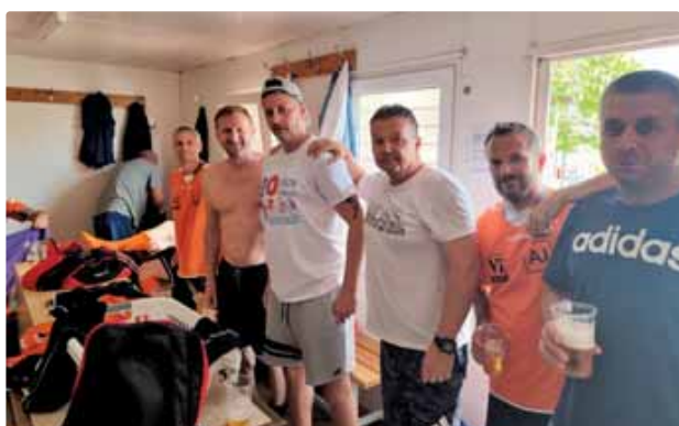
Príprava na zápas