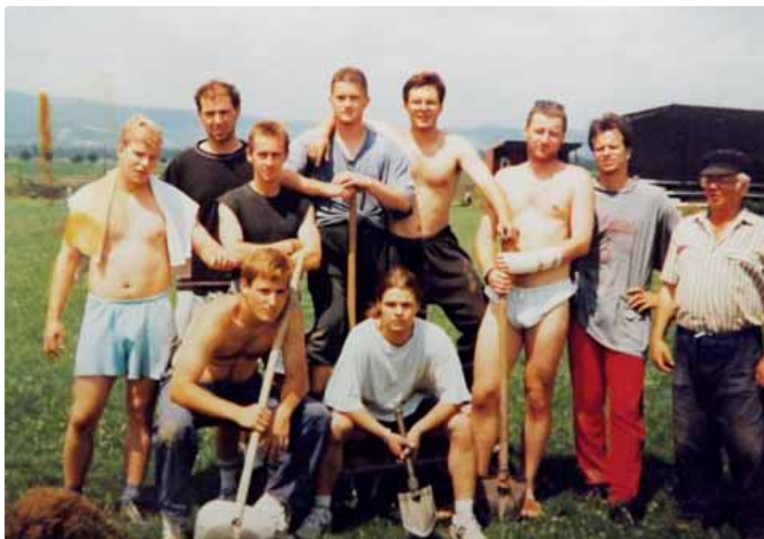
Brigáda v lete 1996