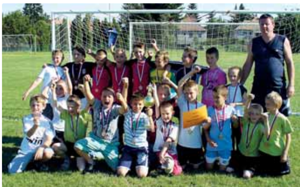
Turnaj detí v Modre (jún 2010)