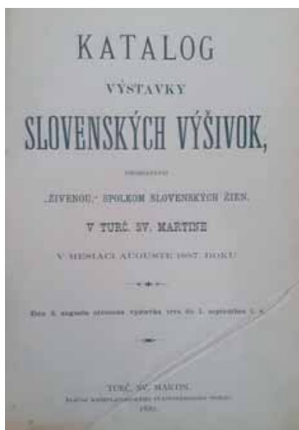
Katalóg k výstave výšiviek