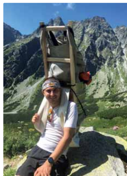
Vynáška na Chatu pod Rysmi

čo musí podariť, tak sa to aj stane. Kolená sa vďaka intenzívnemu tréningu dalo do poriadku natoľko, že ani lekári tomu neverili. O mesiac som už bežal ultra maratón. Ale mal som oveľa horší úraz, ktorý sa mi nestal pri športe, ale v práci. Nerád však o tom rozprávam, lebo aj keď dôsledky úrazu boli priam devastačné, myslím si, že som za chybu iného urobil dôležité rozhodnutie. Ale napriek vážnemu zraneniu by som konal rovnako aj inokedy. To mi zmenilo aj moje nazeranie na život. Človek si začne oveľa viac vážiť zdravie, zdanlivo jednoduché či nedôležité veci a súvislosti.