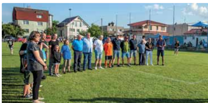
Ocenené legendy FK Vajnory