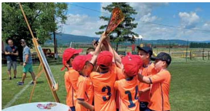
Víťazný tím Igramu