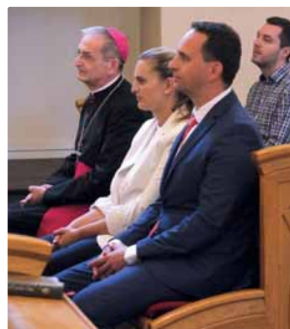
Arcibiskup Zvolenský a starosta Vlček s manželkou