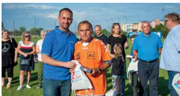
Oceňovanie legend FK Vajnory