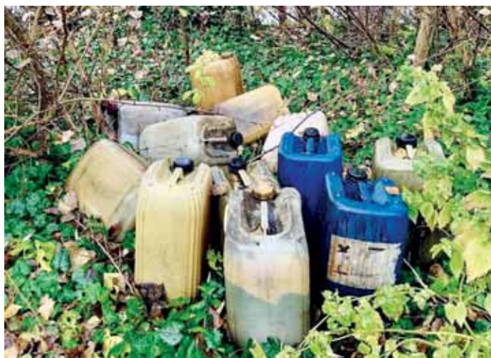
Čierna skládka v lokalite Na bagri

Popri našej práci sa, bohužiaľ, často stretávame aj s ľudskou hlúpostou, bezohľadnosťou a podobnými negatívnymi javmi, ktoré zneprijemňujú život všetkým v našej komunite, hazardujú so životným prostredím a neraz aj ohrozujú bezpečnosť.