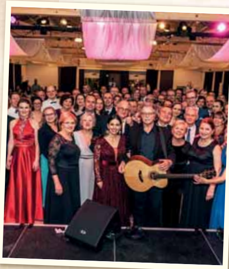
Reprezentačný ples Mestskej časti Bratislava - Vajnory