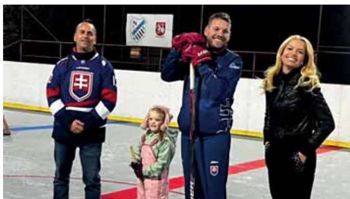
Rozvíjame šport a športovú infraštruktúru v našej mestskej časti. Otvorili sme nové hokejbalové ihrisko. Vyvýjali sme snahu na záchranu futbalového ihriska Vajnory.