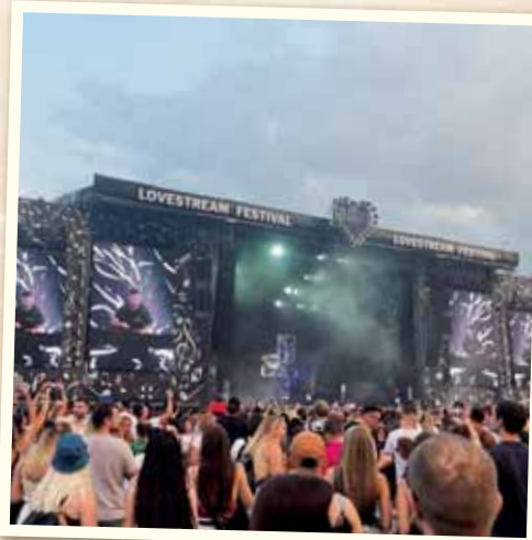
Na Starom letisku bol mega obrovský hudobný festival Lovestream