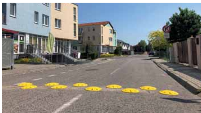
Zvyšujeme bezpečnosť v našej mestskej časti. Podarilo sa nám zabezpečiť zákaz vjazdu nákladných vozidiel, ktoré ohrozovali chodcov cez ulicu Príjazdná.