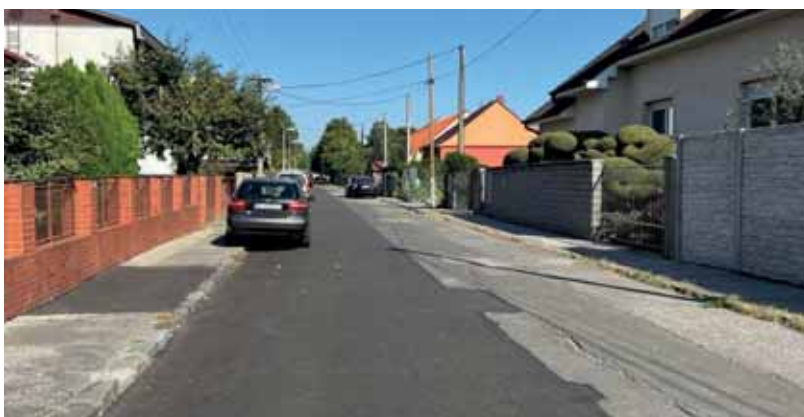
Reagovali sme na parkovacu novetu. Snažili sme sa a snažíme sa uchovať aspoň časť parkovacích miest po nadobudnutí účinnosti zákona zjednosmerním ulíc.