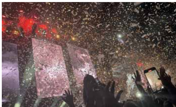
Vo Vajnoroach bol veľký hudobný festival Lovestream.