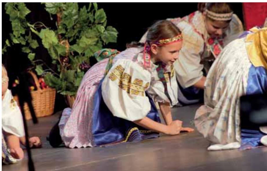
DFS Podobenka z Vajnor

Folklórna skupina Praslica z Kozároviec sa predstavila so žartovným pásmom Priadky – dievky sa museli poupravovať, zaspievať, pričariť mládencom, o zábavu núdza nebola – prišiel aj Mikuláš.