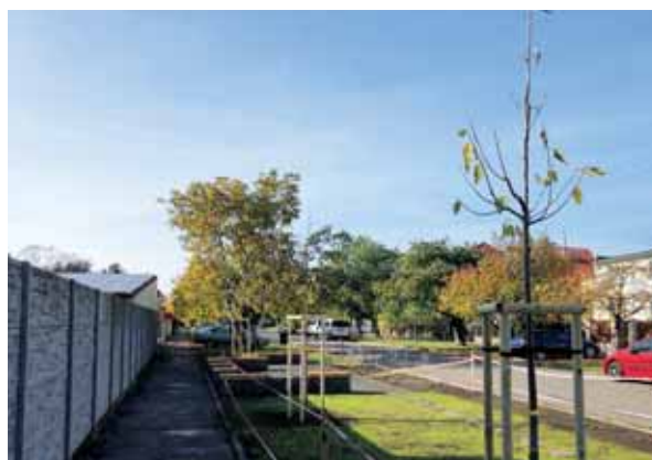
Robíme Vajnory zelenšími. Pravidelne po celý rok pribúdajú nové kvetinové záhony. Zaviedli sme službu Zelený taxík. Pripravujeme vodozadržné opatrenia