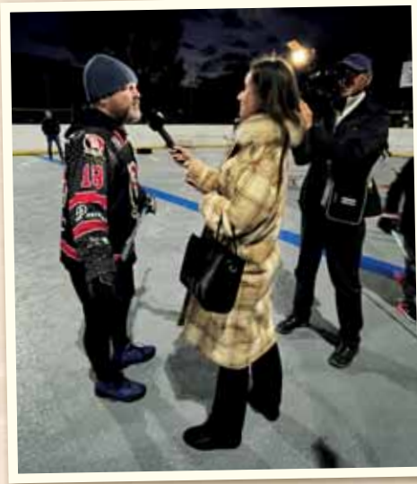
Otvorili sme nové hokejbalové ihrisko