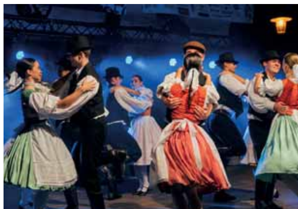
Uchováваме unikátne tradície Dediny v meste. Spojili sme tradičné dožinky a hody do jednej veľkej akcie Dni Vajnory. Podporujeme spolky a združenia. Udržiavanie keramickej dielne.