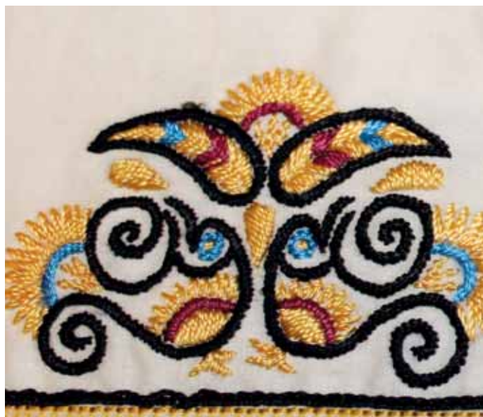
Detail vyšívanvej košeľa