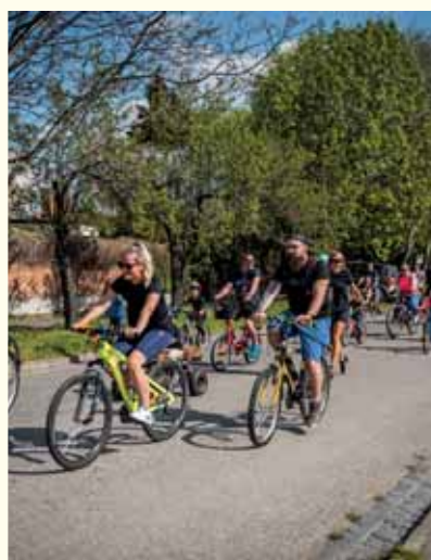
Cyklistickú sezónu otvorili Vajnory na kolieskach