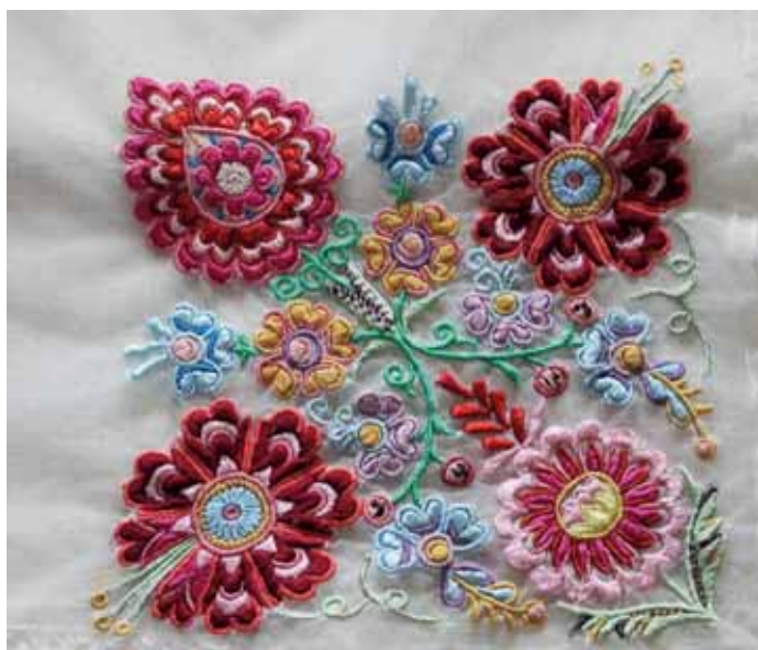
Výšivka na ručníku