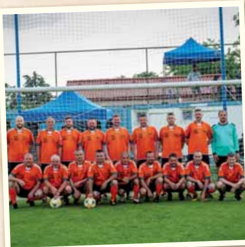
FK Vajnory oslávil 90 rokov