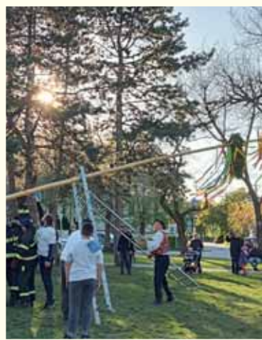
V Parku pod lipami sme postavili tradičný máj