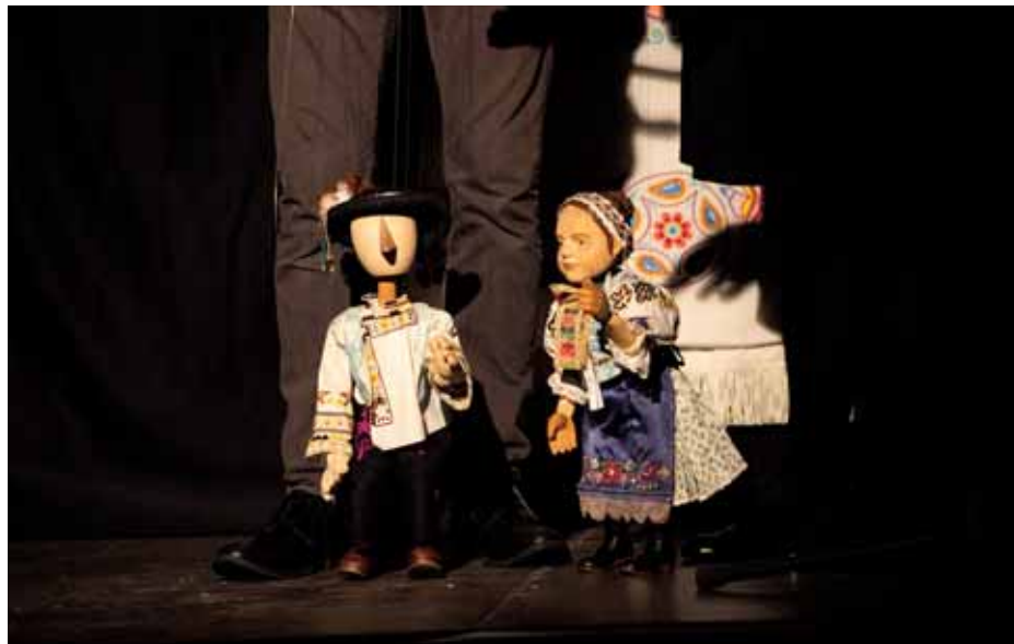
Vajnorský širáček a Podobenka

Po úvodnom čísle celé podujatie slávnostne otvorili starosta mestskej časti Bratisla-