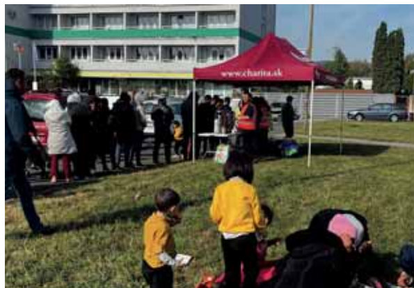
Riešili sme krízové situácie namiesto štátu. Celú jeseň a zimu sme riešili migračnú krízu, snažili sme sa, aby boli migranti sústredení na jednom mieste a neblúdili ulicami Vajnor.