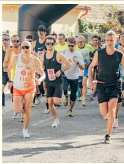
V krásny jesenný deň sa uskutočnil Vajnorský minimaratón