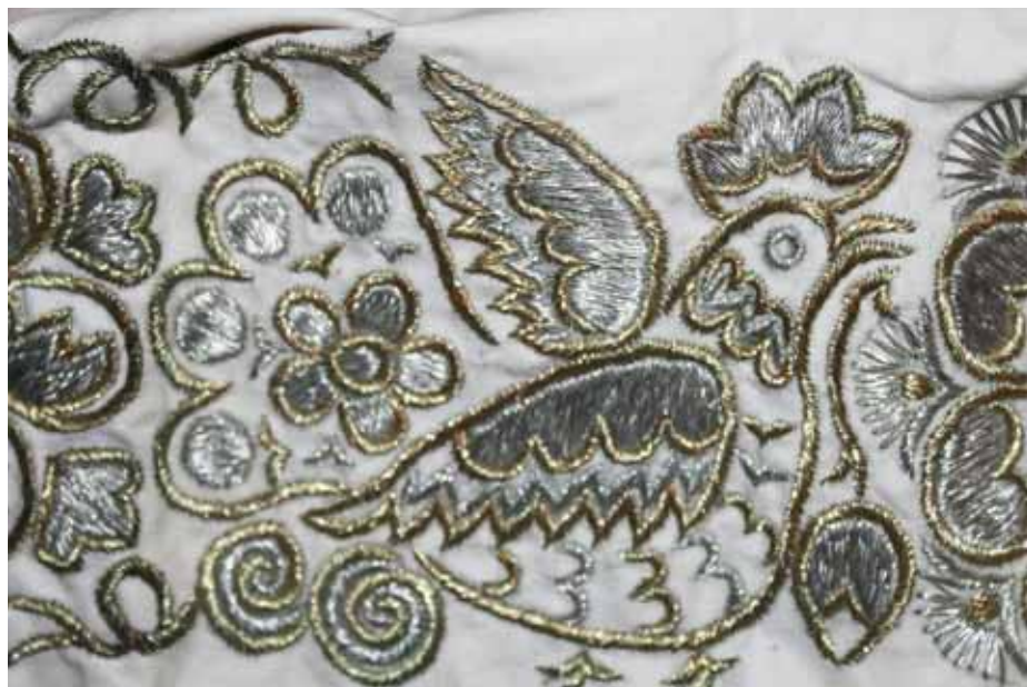
Detail výšivky rukávco