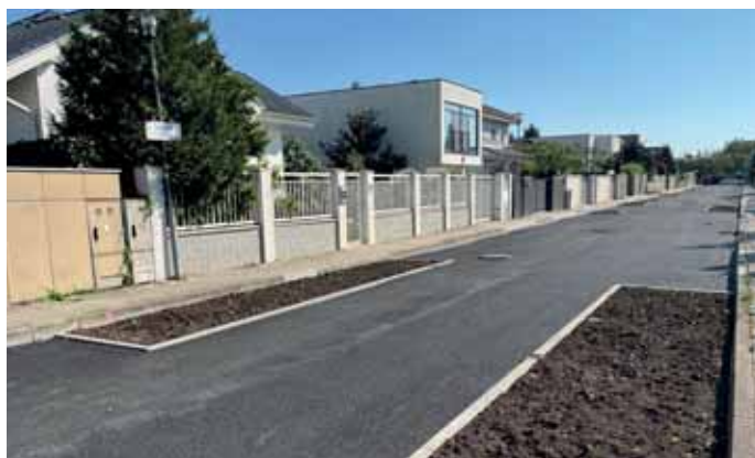
Zveľaďujeme verejné priestranstvá. Vybudovali sme ulicu Široká ako príklad modernej ulice 21. storočia.