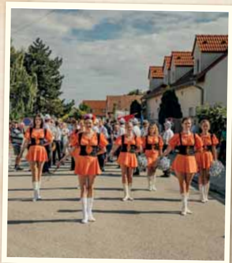
Hody a dožinky sme spojili do veľkolepého Dňa Vajnor