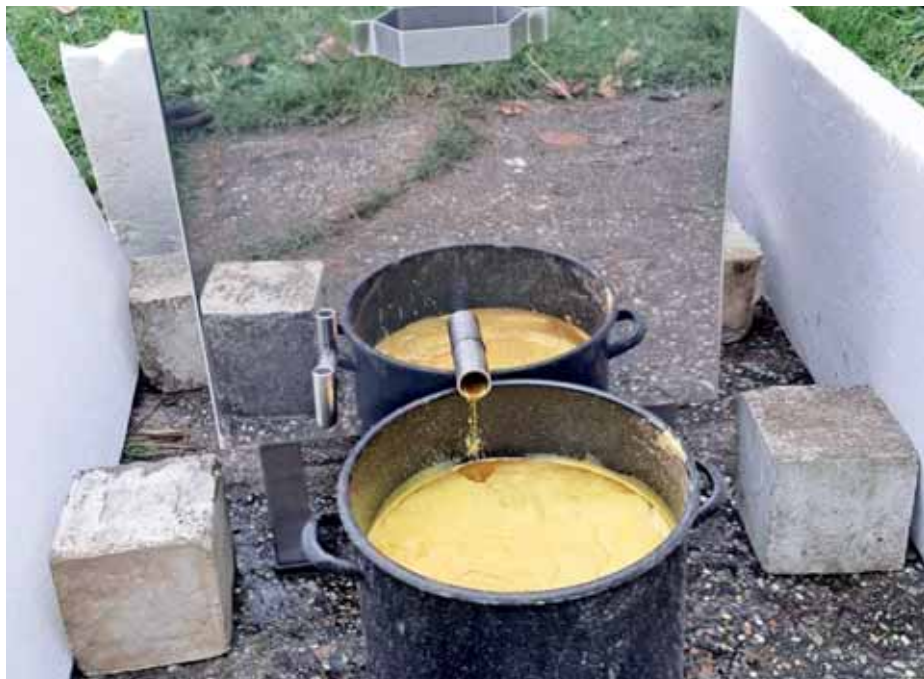
Voskotopka vo vajnorskej včelnici bola inštalovaná začiatkom decembra

Návrhy treba zaslať do 15. februára 2024