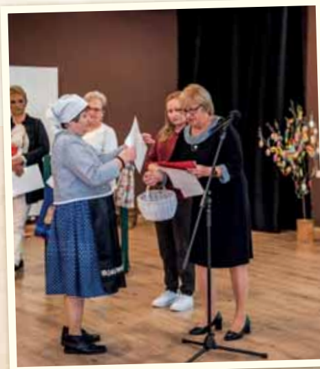
Na kvetnú nedeľu sme vybrali výhercov súťaží o najkrajšiu kraslicu